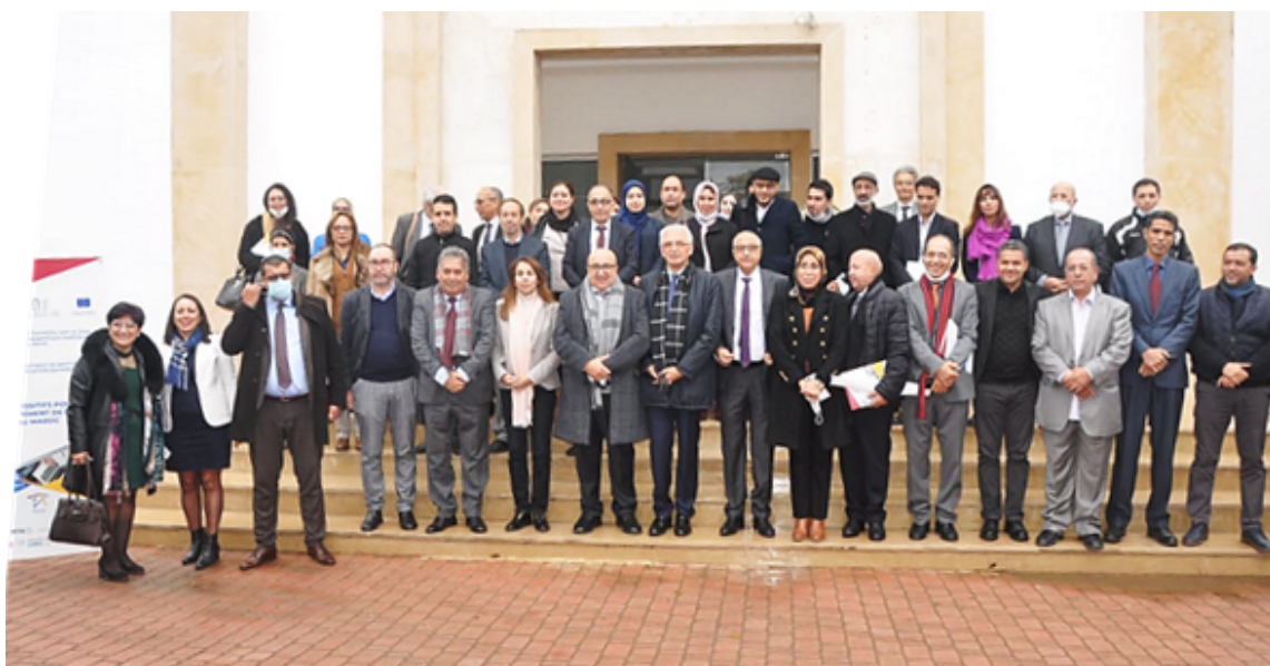
Photo de groupe à l'UM5 Rabat

Le Séminaire thématique de restitution et de concertation nationale organisé du 24 au 26 novembre 2021 à l'Université Mohammed V de Rabat avait pour ambition d'exposer les nouveaux « Dispositifs pour le développement de la formation tout au long de la vie au Maroc » ainsi que les réalisations du projet Erasmus+ AMEL. Ont participé au séminaire, les représentants des seize établissements partenaires du projet, ainsi que les parties prenantes et partenaires associés (Ministères, entreprises privées, médias, agences, associations professionnelles et étudiantes...).